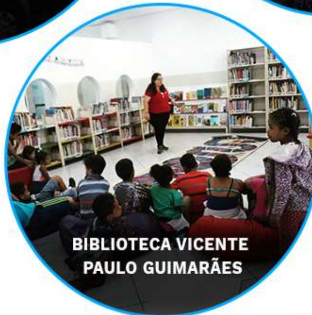
BIBLIOTECA VICENTE PAULO GUIMARÃES