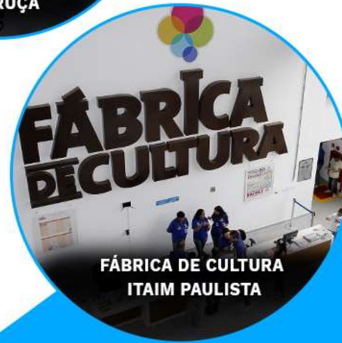
FÁBRICA DE CULTURA ITAIM PAULISTA