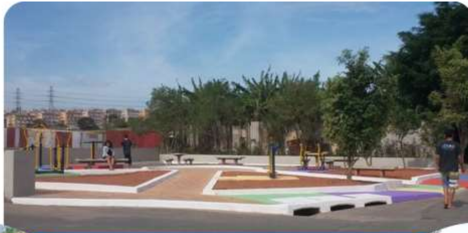
PRAÇA BEIRA RIO - CIDADE KEMEL