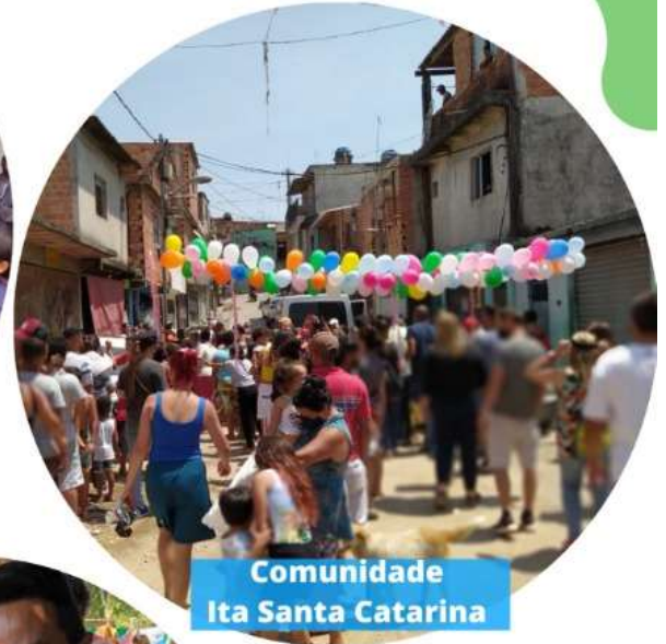
Comunidade Ita Santa Catarina