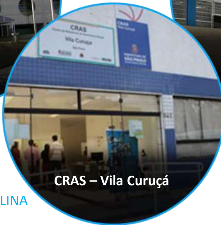
CRAS – Vila Curuçá

33 SERVIÇOS SOCIAIS 25 UNIDADES DE SAÚDE 01 HOSPITAL SANTA MARCELINA 01 REDE HORA CERTA