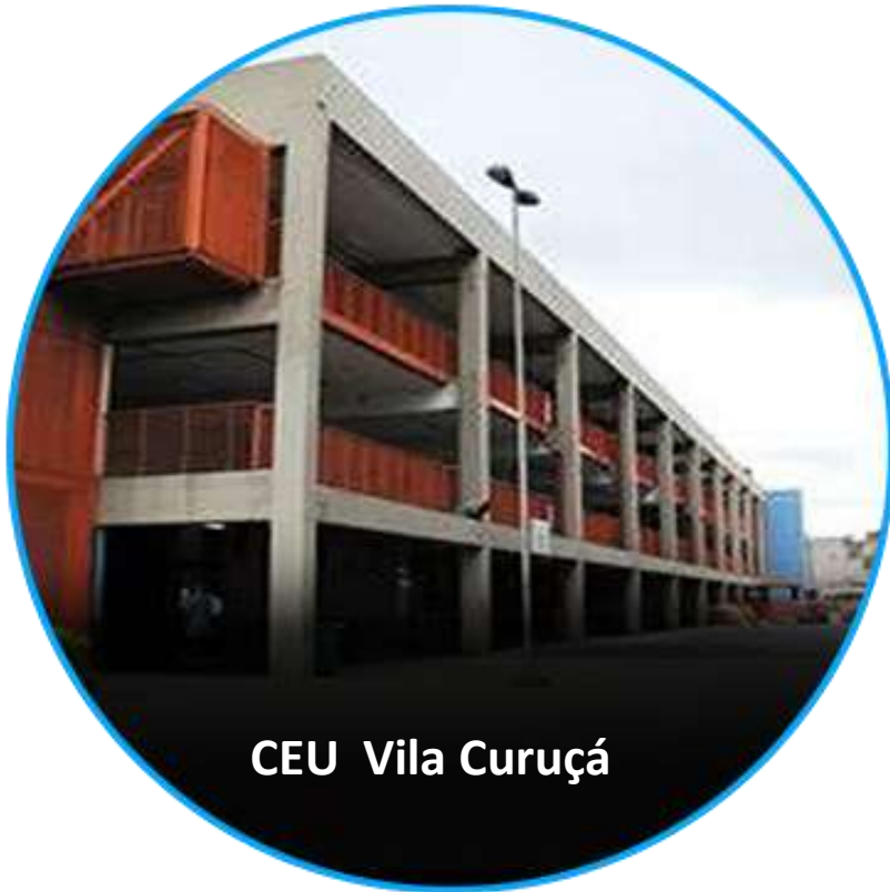
CEU Vila Curuçá