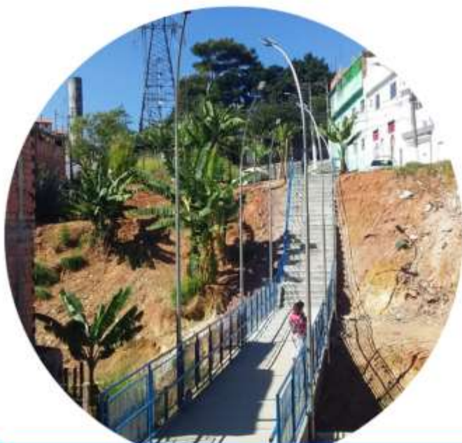
Entre ruas Daniel Muller e Maria Célia Corrêa Jd. Camarmargo Velho.