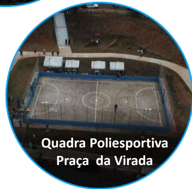
Quadra Poliesportiva Praça da Virada

137 PRAÇAS 20 QUADRAS POLIESPORTIVAS 12 CLUBES DA COMUNIDADE 06 PARQUES (02 LINEARES) 03 RUAS DE LAZER 01 CLUBE ESCOLA