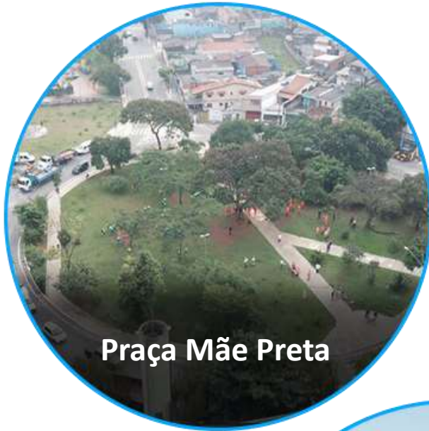
Praça Mãe Preta