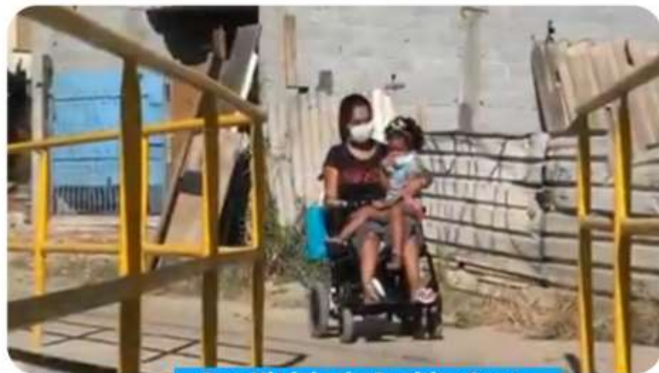
Rua Vitória do Espírito Santo Jd. Miriam

Neste ano, foram concluídas 6 passarelas.