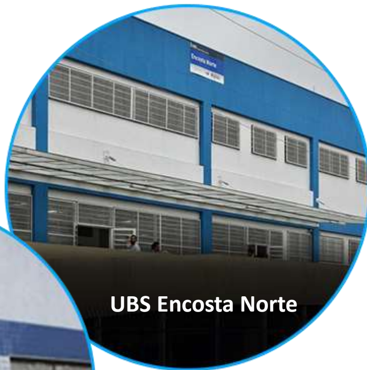
UBS Encosta Norte