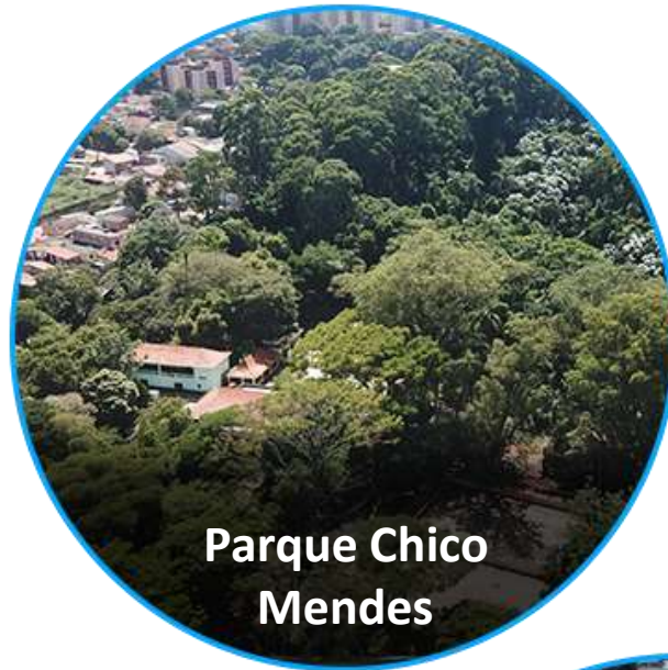
Parque Chico Mendes