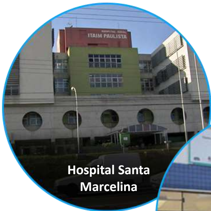
Hospital Santa Marcelina