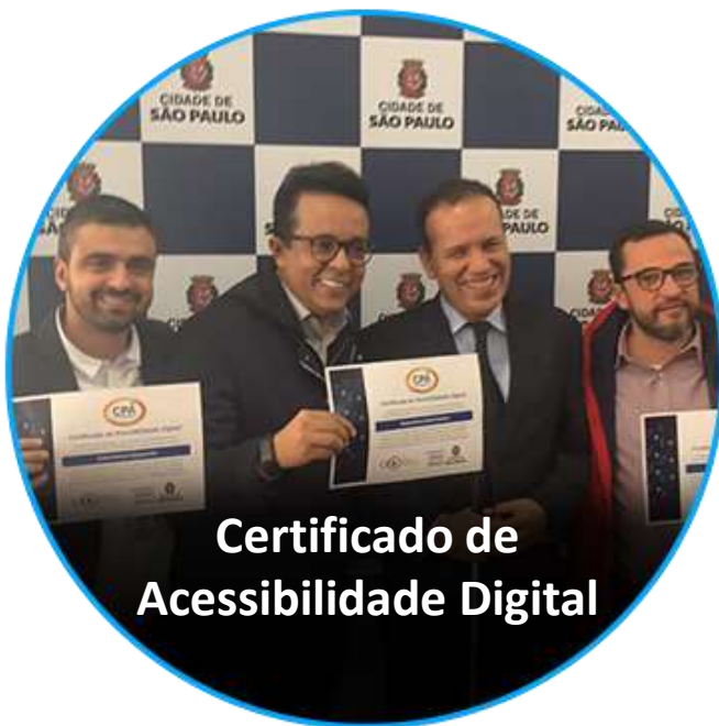
Certificado de Acessibilidade Digital

ATUALMENTE, A SUBPREFEITURA POSSUI DUAS REDES SOCIAIS ( FACEBOOK E INSTAGRAM ). ALÉM DAS REDES, ESTAMOS ATIVOS NO SITE E, RECENTEMENTE, RECEBEMOS O CERTIFICADO E SELO DE ACESSIBILIDADE DIGITAL .