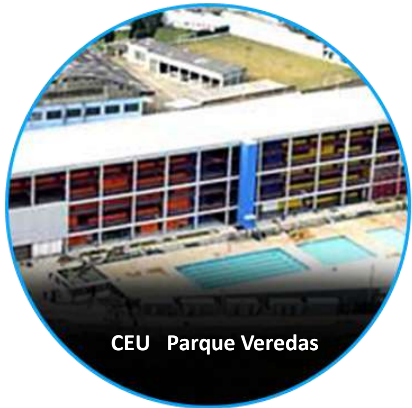
CEU Parque Veredas

147 ESCOLAS: 88 NO ITAIM 59 NA VILA CURUÇÁ