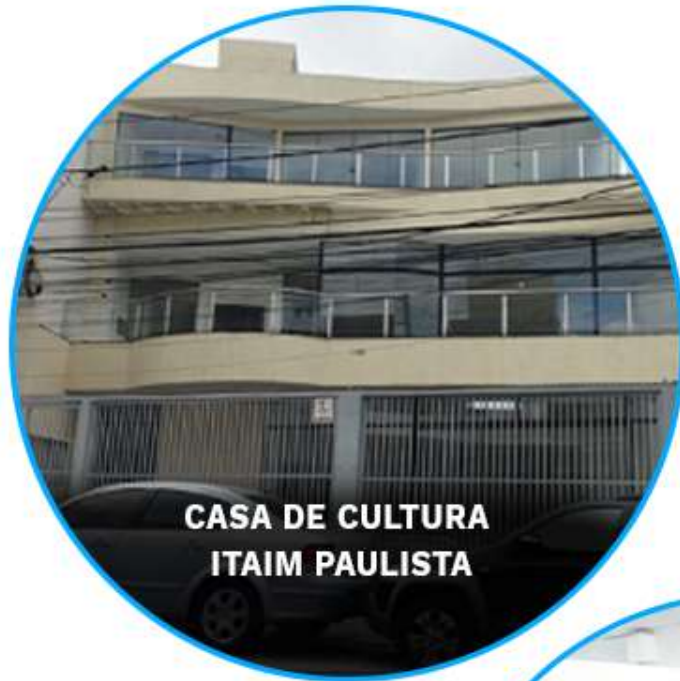
CASA DE CULTURA ITAIM PAULISTA