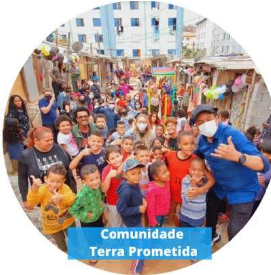
Comunidade Terra Prometida