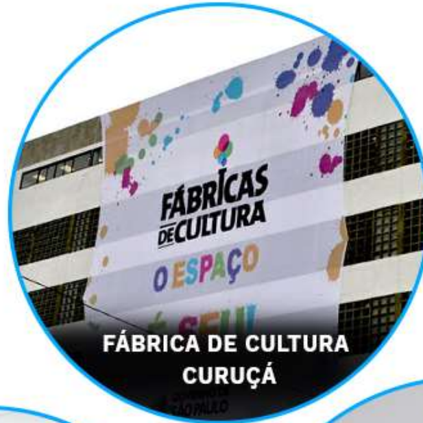
FÁBRICA DE CULTURA CURUÇÁ