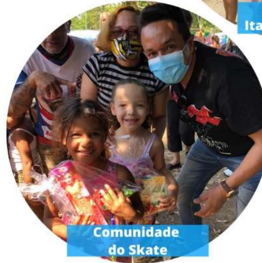
Comunidade do Skate